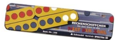
Rechenschiffchen aus Karton Westermann A546

Bitte Bücher, Hefte und Materialien außen gut sichtbar mit Namen versehen! Kein Hausaufgabenheft kaufen – wird von der Schule besorgt!!!